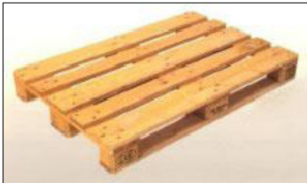
Europallet homologado 1200x800 Mm.