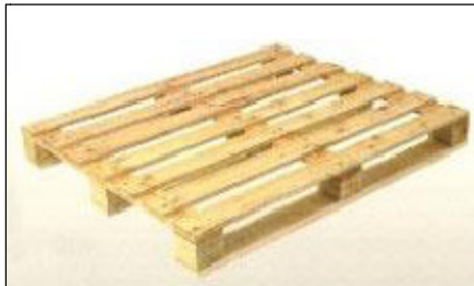
Pallet no reversible para el apilado con carga a varias alturas 1200x800 Mm.